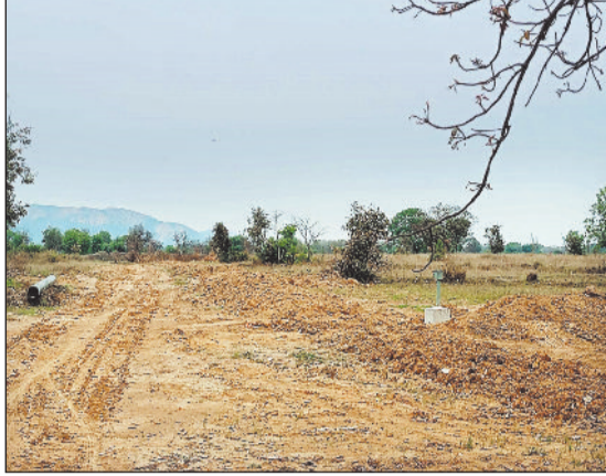
गैस पाइप लाइन के लिए खोदे गए गड्ढे।

मुंबई-नागपुर-झारसुगुड़ा नेचुरल गैस पाइप लाइन बिछाने का काम लंबे समय से चल रहा है। पाइप लाइन बिछाने का काम गैल इंडिया कर रही है। बराली के पास इस कंपनी की ओर से प्लांट भी लगाया गया है। जानकारी के अनुसार